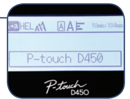
Grafisch display met afdrukvoorbeeld