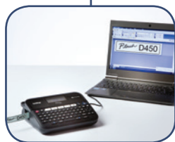
Print labels vanaf uw PC of Mac