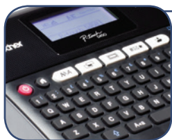
Gebruiksvriendelijk PC toetsenbord