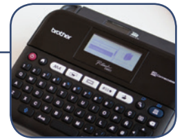
Ingebouwde, bewerkbare labelsjablonen