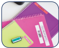
Print labels van 3,5 – 18 mm breed

De P-touch D450VP creëert duurzame, vervagingbestendige labels via het eenvoudig te gebruiken toetsenbord of rechtstreeks vanaf uw computer of laptop met de P-touch Editor labelontwerp-software. Het grote LCD kleurenscherm waarop het label vooraf bekeken kan worden en het brede PC toetsenbord, maken het zeer eenvoudig om labels af te drukken in diverse kleuren en maten. Dankzij de hoge printsnelheid en het automatische snijmechanisme maakt u snel een op maat gemaakt label voor elke toepassing. Maak verbinding via een PC of Mac en gebruik verschillende lettertypen, tekenstijlen, afbeeldingen en kaders om eigen labels te ontwerpen. U kunt zelfs verwijzen naar een Microsoft Excel bestand, om zodoende grote hoeveelheden labels met verschillende informatie in één keer af te drukken. Dit beletteringsysteem is het ideale hulpmiddel als het gaat om het ordelijk houden van het kantoor, doormiddel van het duidelijke markeren van belangrijke items met P-touch labels.