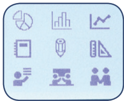
14 lettertypen ; 99 kaders Meer dan 600 symbolen