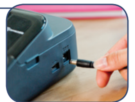
Gebruikt 6 x AA batterijen* of meegeleverde AC adapter