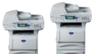
MFC-8820D Zonder / met extra papierlade