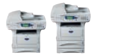
MFC-8420 Zonder / met extra papierlade