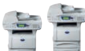
MFC-8820DN Zonder / met extra papierlade