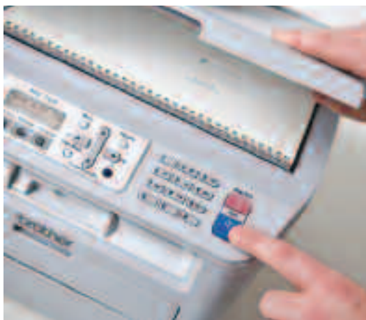
Fax, kopieer of scan uw ingebonden documenten.