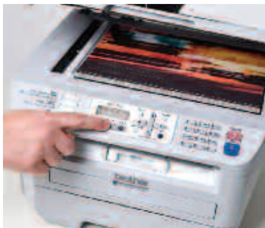
Scan kleur en monochroom in hoge kwaliteit.

PC-Fax: Met de PC-Fax functie kunt u documenten vanaf uw PC direct faxen vanuit uw tekstverwerkingsprogramma. Het PC-Fax adresboek zorgt ervoor dat u alle contacten overzichtelijk kunt bijhouden.