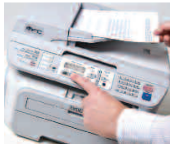
Automatische document invoer – ideaal bij het faxen, kopiëren of scannen van meerdere pagina's.

Veel meer dan alleen een printer, de MFC-7320 heeft alle functies in huis die u wilt hebben.