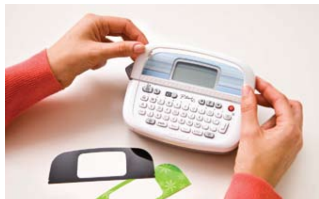
Verander het uiterlijk van uw P-touch 90 met de drie meegeleverde frontplaatjes.

De compacte, gebruiksvriendelijke en stijlvolle P-touch 90 is dé oplossing voor het ordenen van dossiers en mappen, maar helpt u ook bij het structureren van vele andere items in en rond het huis.