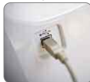
2 e USB poort