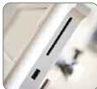
USB en borduurkaarten poort