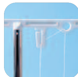
Bescherming voor draadverwarring